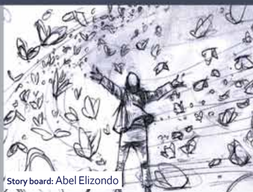
Storyboard: Abel Elizondo

Co-producción de Festival Stgo a Mil y Teatro Cinema