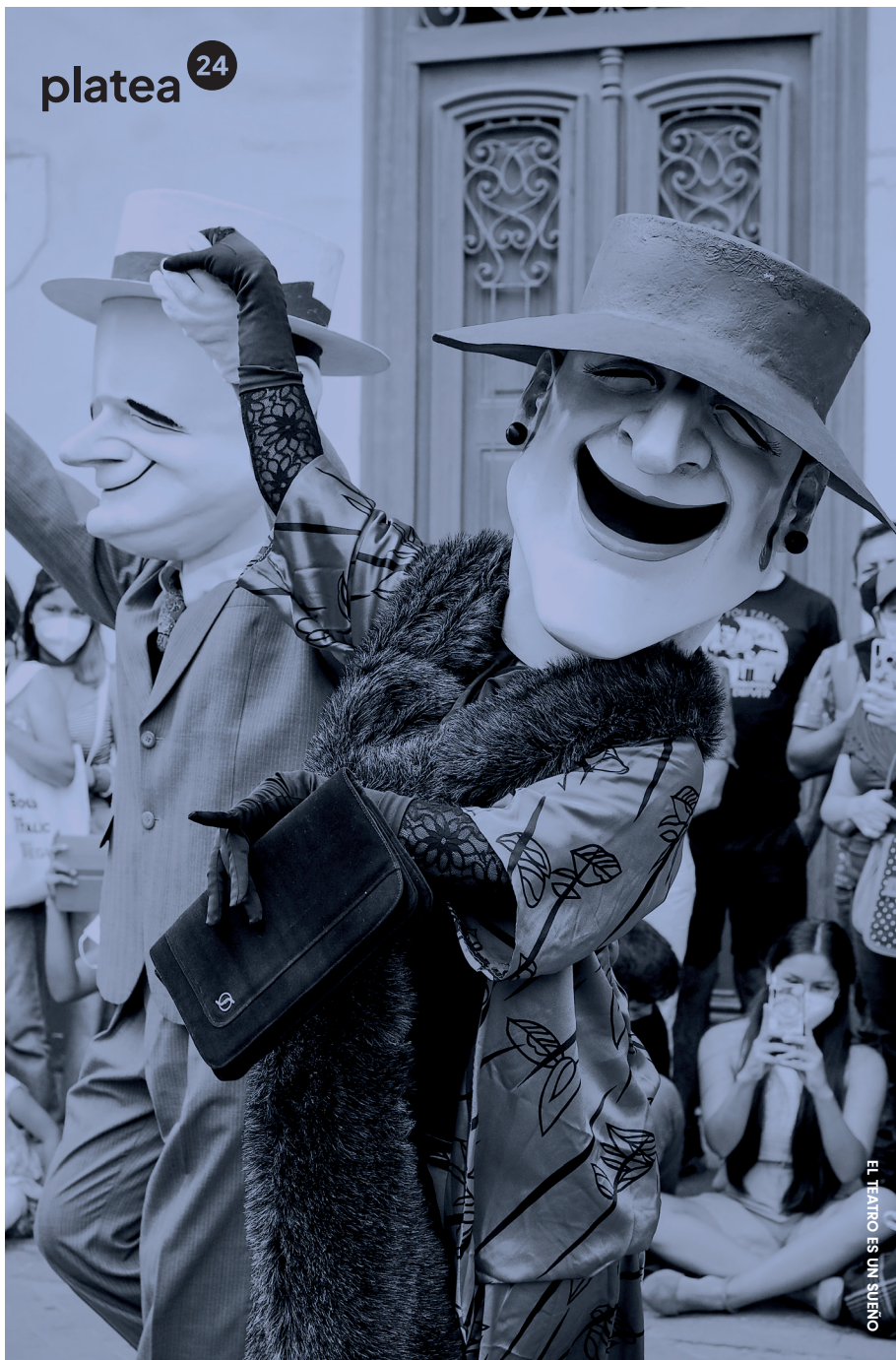
EL TEATRO ES UN SUEÑO